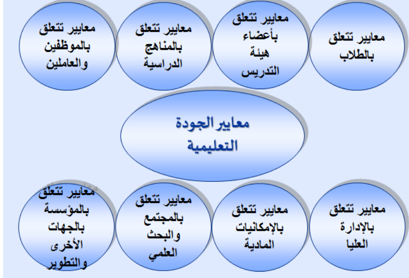
الشكل (3) أهم معايير الجودة التعليمية في مؤسسات التعليم العالي

تم استلام الورقة بتاريخ: 2023/07/30م وتم نشرها على الموقع بتاريخ: 2023/10/01م